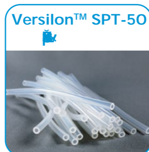
Versilon™ SPT-50 Իրիչիչ